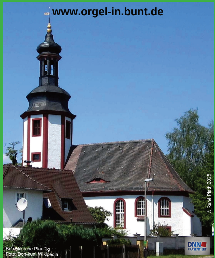
Barockkirche Plaußig