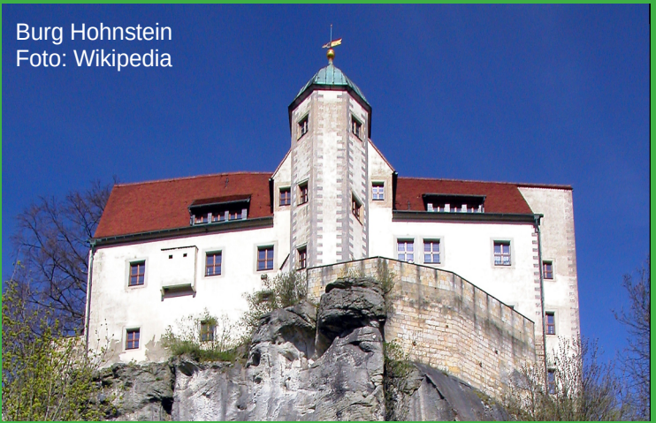
Burg Hohnstein

Zu Mittag sind wir auf der Burg Hohnstein, danach ist eine Führung möglich. Die Burg gab auch der umliegenden Siedlung den Namen. Der Ort wurde 1317 erstmals urkundlich erwähnt. Die heutigen Gebäude entstanden im 17. und 18. Jahrhundert.