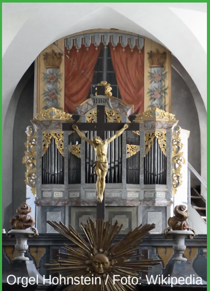
Orgel Hohnstein

Die Orgel der Stadtkirche geht auf ein Instrument aus dem Jahre 1678 zurück, welches ursprünglich in Stöntzsch bei Leipzig stand, 1732 von Joh. Seb. Bach geprüft und im Laufe der Zeit mehrfach umgebaut wurde. 1965 kam das Instrument nach Hohnstein und erhielt seine heutige Gestalt mit 15 Registern.