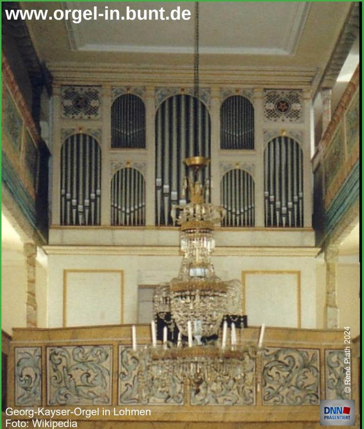
Georg-Kayser-Orgel in Lohmen