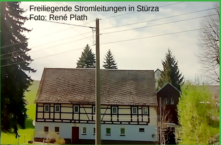
Freiliegende Stromleitungen in Stürza

Wir starten in Stürza, erstmals 1386 als „Stercze“ erwähnt. In der Kirche aus der Mitte des 14. Jahrhunderts finden wir eine Jehmlich-Orgel aus dem Jahre 1933, wie sie im Dresdener Raum häufig zu finden sind. Eine besondere „Sehenswürdigkeit“ sind selten gewordene freiliegende Stromleitungen.