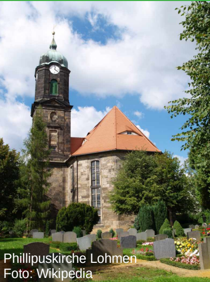
Phillipuskirche Lohmen

Wir starten in Stürza, erstmals 1386 als „Stercze“ erwähnt. In der Kirche aus der Mitte des 14. Jahrhunderts finden wir eine Jehmlich-Orgel aus dem Jahre 1933, wie sie im Dresdener Raum häufig zu finden sind. Eine besondere „Sehenswürdigkeit“ sind selten gewordene freiliegende Stromleitungen.