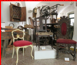
Deutsches Stuhlbaumuseum Rabenau